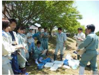
流域モニタリング一斉調査の様子