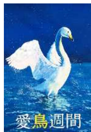
『公益財団法人日本鳥類保護連盟会長賞』