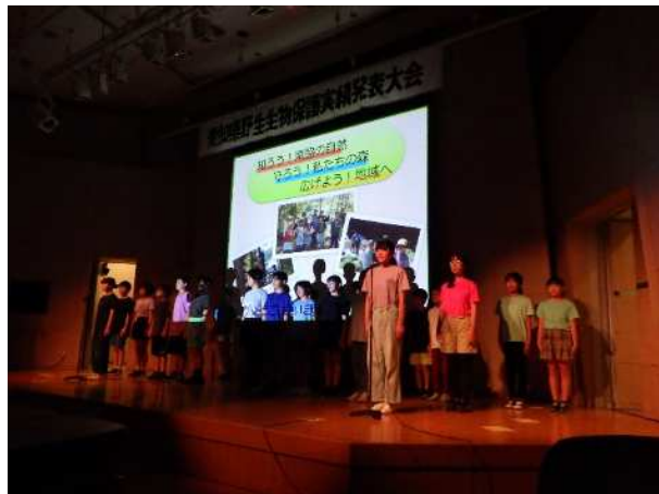
第53回愛知県野生生物保護実績発表大会の様子

学校・団体において行われている野生生物の保護活動の状況及びその実績について発表大会を開催し、保護活動意識の高揚と県民の野生生物に対する保護思想の普及・啓発につとめています。