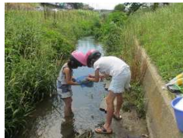
水質パトロールの様子

水環境への関心を高め、生活排水対策の大切さを理解してもらうため、小中学生を中心としたグループに身近な川の水質や水辺の生きものなどを調べてもらう取組です。