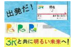
小学生高学年の部 最優秀賞 刈谷市立住吉小学校 5年生

◇3R活動推進フォーラムのWebページ https://www.3r-forum.jp/