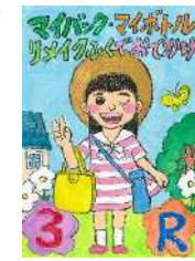
小学生低学年の部 最優秀賞 安城市立安城東部小学校 1年生