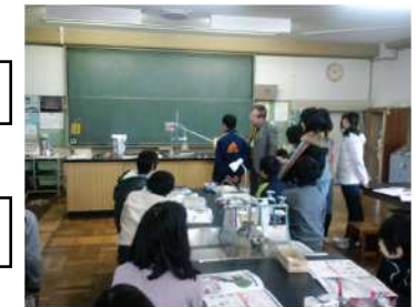
ストップ温暖化教室の様子

白熱電球とLED電球の消費電力を比較し、どちらが地球に優しい電球なのかを考える。