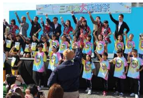
三河湾大感謝祭の様子

県民、NPO、市町村及び県が一体となって、三河湾の環境再生に向けた取組の機運を高めるため、「三河湾環境再生プロジェクト-よみがえれ！生きものの里“三河湾”-」として「三河湾大感謝祭」や「三河湾環境再生体験会」など様々な事業を展開しています。