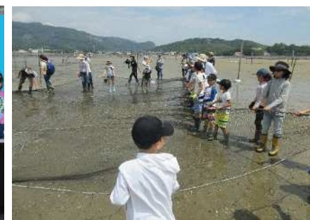
三河湾環境再生体験会の様子

◇「三河湾環境再生プロジェクト-よみがえれ！生きものの里“三河湾”-」Webページ https://kankyojoho.pref.aichi.jp/mikawanpj/